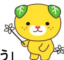
愛媛県イメージアップキャラクター 「みきちゃん」

入場は無料です。どなたでも参加できる集いです。 一人でも多くの皆様の御来場をお待ちしています。