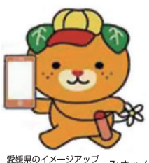
愛媛県のイメージアップキャラクター みきゃん

私たちは子供たちの情報モラル育成に取り組みます 愛媛県 PTA 連合会 愛媛県教育委員会 愛媛県 × 文部科学省