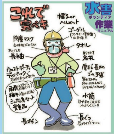
NPO 法人 「レスキューストックヤード」作成 TEL 052-253-7550