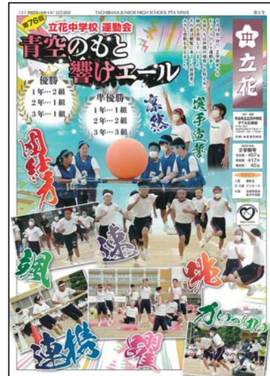
今治市立立花中学校PTA