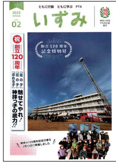
西条市立神拝小学校PTA